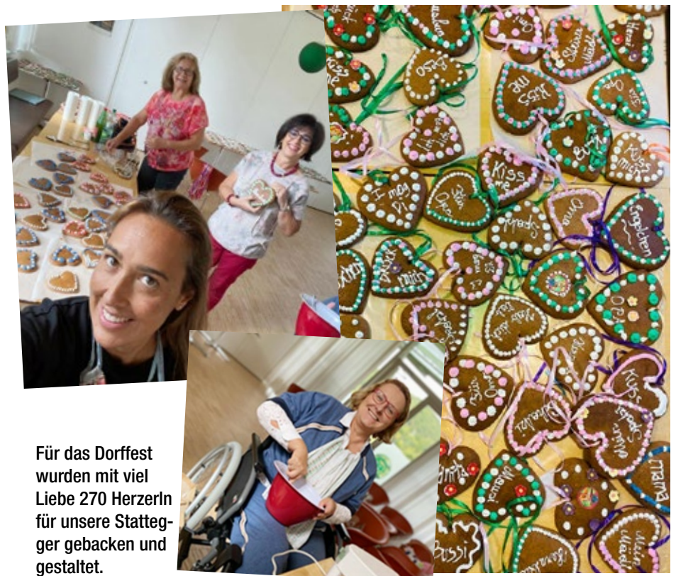
Für das Dorffest wurden mit viel Liebe 270 Herzerl für unsere Stattegger gebacken und gestaltet.