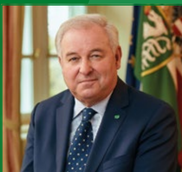
Hermann Schützenhöfer Landeshauptmann