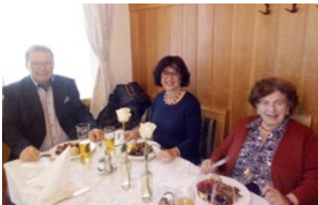
Ein Highlight im Herbst war das Martini Ganserl-Essen beim Feldwirt: Einfach ein Gedicht!