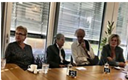
Im ansprechenden Ambiente von Turners Café fand die erste Auflage unseres Erzählcafé-Treffens statt.