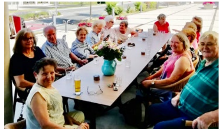
Anfang Juli wurde der Vorstand gewählt und danach noch in geselliger Runde zusammengessen.